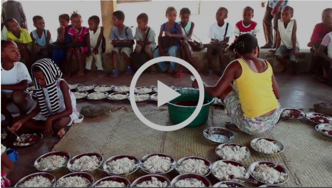
Ecole des Saphirs - Village d'Antsoamadiro - Région Atsimo Andrefana - Madagascar