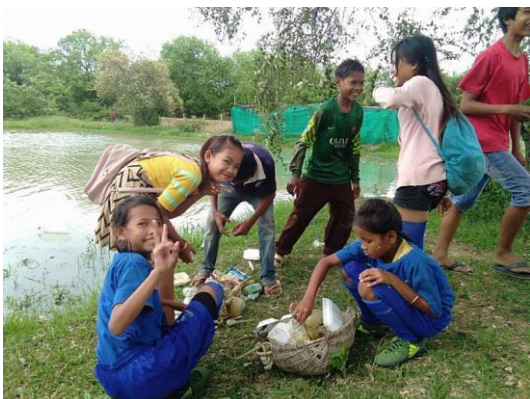
Cambodge : Ramassage de déchets