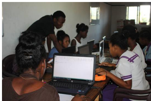
Madagascar : Des cours d'informatiques enrichissants