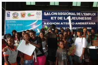
Madagascar : Les