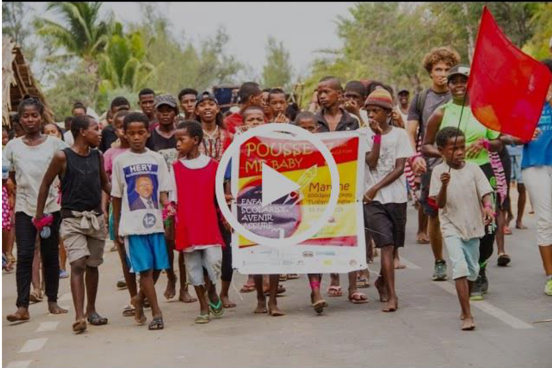
Pouss Me Baby : La mobilisation de jeunes malgaches pour l'éducation

Madagascar : Nouveau succès pour la marche solidaire "Pouss me baby"