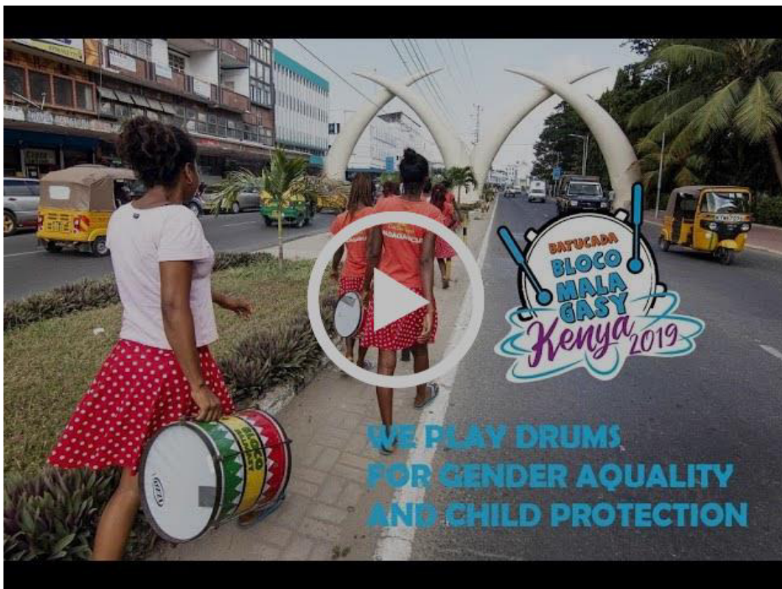
Les jeunes de l'atelier Bloco Malagasy de retour du Kenya !

Madagascar : «Usawa wa kijinsia na ulinzi wa watoto» un nouveau cri de ralliement au Kenya