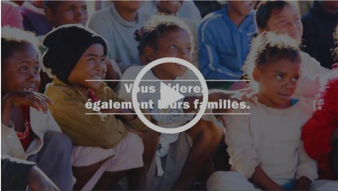
L'école des Saphirs à Antsoamadiro